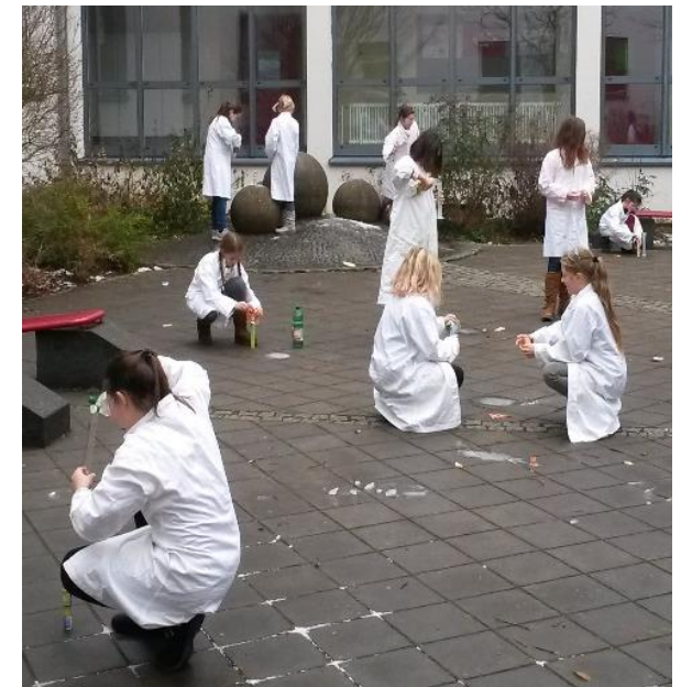
Bei uns wird sogar der Schulhof zum Versuchslabor...

Die Forscherklasse besucht ein spezielles Forscher-Schullandheim. Zudem erhältst du exklusive Einblicke in die Chemiewerke in Burghausen.